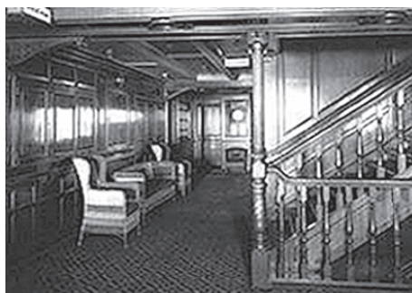
paluba II. třída cena 19,5£ 577 CZK