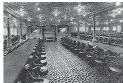
paluba III. třída cena 14£ 420 CZK

Prodej místenek: SLUNA, TŠ VÍTR v lekcích